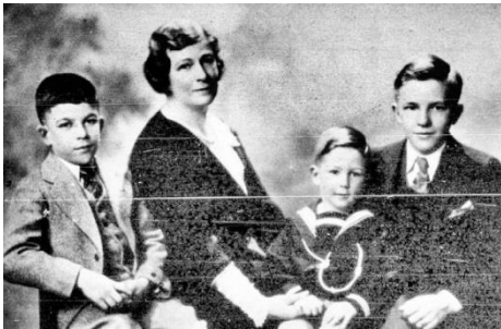
Photo de sa famille en 1932.