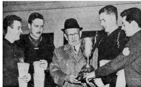
Il remet son trophée de curling pour le 44 e fois en 1966.